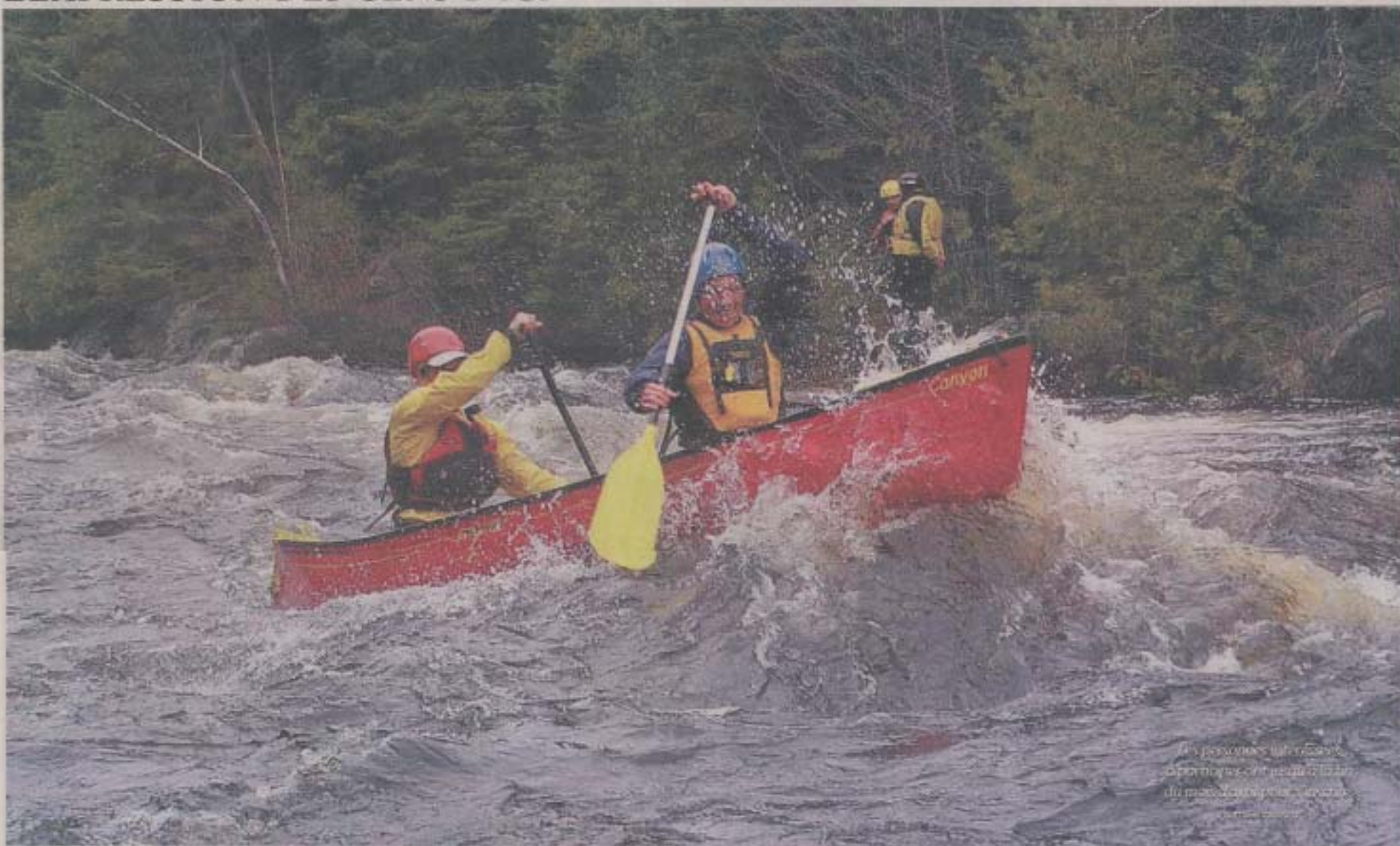
Les personnes qui réussissent à naviguer sur les rapides de la rivière L'Assomption ont jusqu'à la fin du mois d'avril pour s'inscrire.