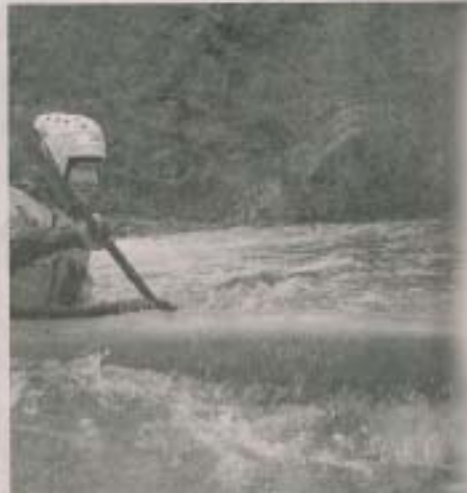
Cette première descente s'adresse à des gens expérimentés.