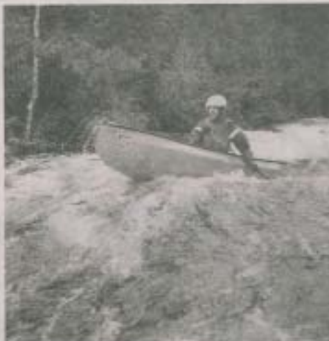
Si les conditions climatiques ne permettent pas la tenue de l'événement, il sera annulé.